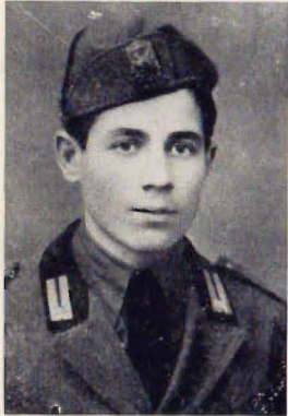
Art. Ferdinando Meli