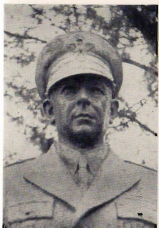
Gen. Antonio Gandin