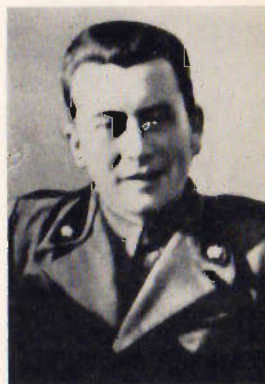
Art. Angelo Scotti