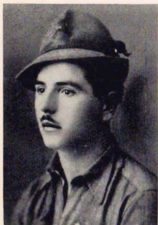
C/le Benedetto Maffei