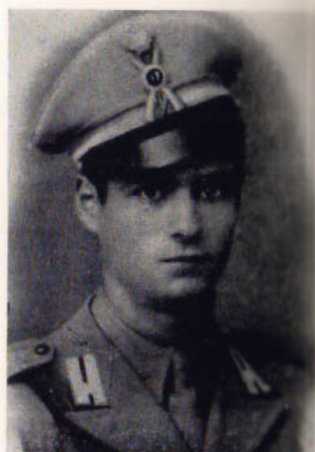
Ten. Ettore Ferrari