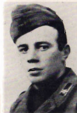
Sold. Salvatore Roversi