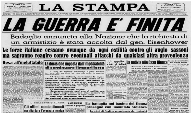
Prima pagina de "LA STAMPA" del 9 settembre 1943.

rizzati da ideologie diverse, ma uniti dalla volontà di combattere per l'unità e la libertà nazionale. Nell' Europa orientale , invece, oltre alla lotta contro il nemico, la Resistenza causa numerosi scontri civili. In particolare in Italia , il movimento della Resistenza si sviluppa in seguito all'occupazione tedesca del 1943, in contemporanea con l'avanzata degli anglo-americani da sud, trasformandosi lentamente in una lotta di tipo armato. Ad aderire sono persone comuni e, principalmente, giovani rimasti delusi dal regime fascista e soldati stranieri fuggiti dal nemico tedesco. Questo causa una dura reazione da parte dei soldati del Reich, che attuano una vera e propria politica repressiva nei confronti dei ribelli civili. L' 8 settembre 1943 ci fu l'Armistizio di Badoglio, che