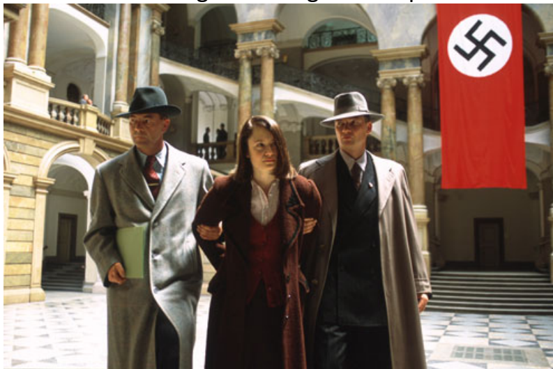
La protagonista, Sophie Scholl, in una scena tratta dal film.

Der Film “Sophie Scholl – Die letzten Tage” erzählt die Geschichte von die Geschwister Sophie und Hans Scholl. Sie versuchen, das ihnen Mögliche gegen die Herrschaft der Nationalsozialisten zu unternehmen. Sie bringen Flugblätter in Umlauf und schreiben anti-faschistische Parolen an Häuserwände. Am 18. Februar 1943 legen sie in der Universität von München Flugblätter aus, werden dabei beobachtet und anschließend verhaftet. An diesem Tag setzt der Film an und erzählt die folgenden Tage von Sophie Scholl.