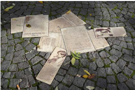
Alcuni dei volantini de “La Rosa Bianca”

Nonostante proprio in Germania si sia sviluppato il movimento nazista, anche qui non mancò il fenomeno della Resistenza. Si trattava principalmente di piccoli gruppi di persone di orientamento socialista e comunista, che però rimanevano isolati senza una base consolidata tra il popolo. Questo a causa del forte sentimento di obbedienza e devozione che il popolo tedesco provava nei confronti del proprio Führer Adolf Hitler, visto come colui che avrebbe salvato e risollevato il paese.